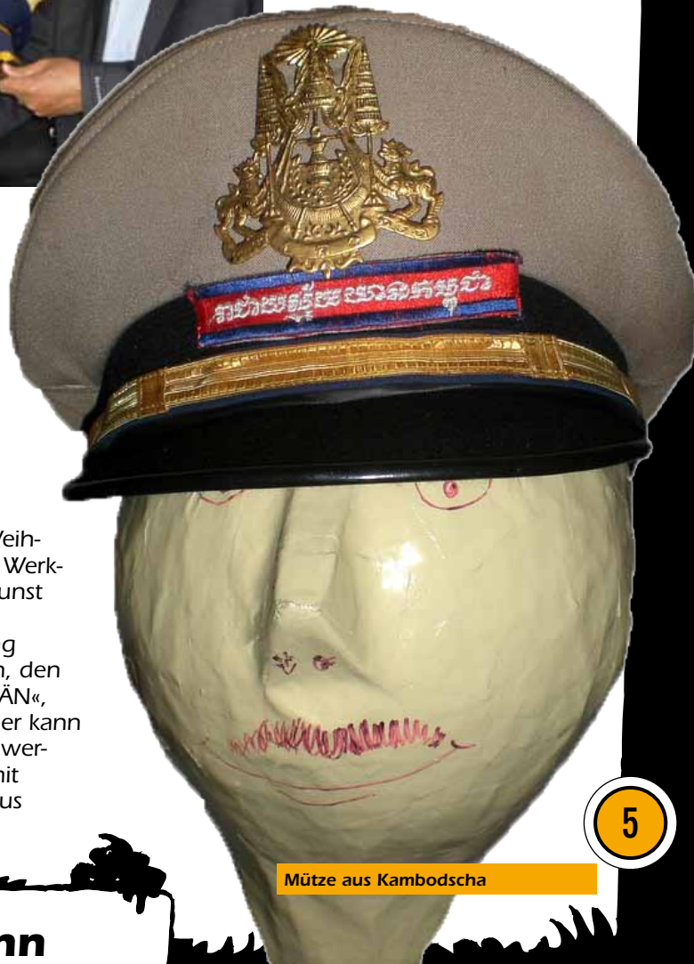
Mütze aus Kambodscha