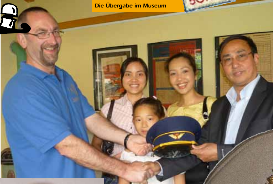
Die Übergabe im Museum